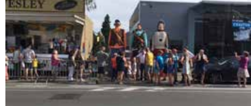
Kermissen en reuzen p. 2 en 3