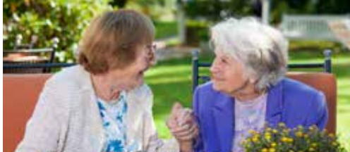
OCMW investeert in terrasmeubilair p. 2